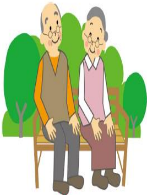
ผู้สูงอายุ