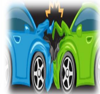
อุบัติเหตุ