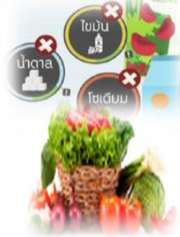
อาหารปลอดภัย