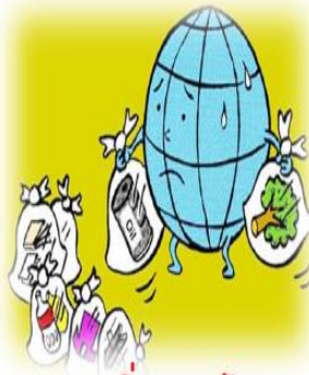
ขยะ สิ่งแวดล้อม